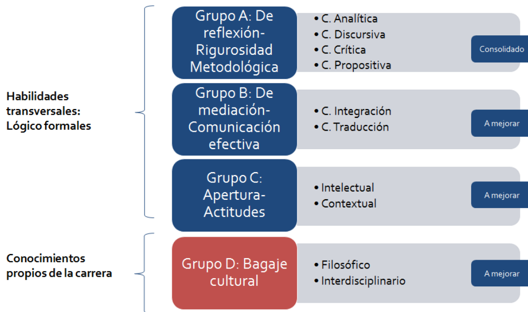
Gráfico 1: Competencias laborales en Filosofía 10